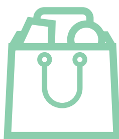
Feria libre/ Comercio