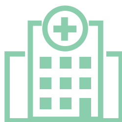
Hospital y/o Consultorio