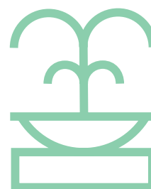
Plaza y/o Parque