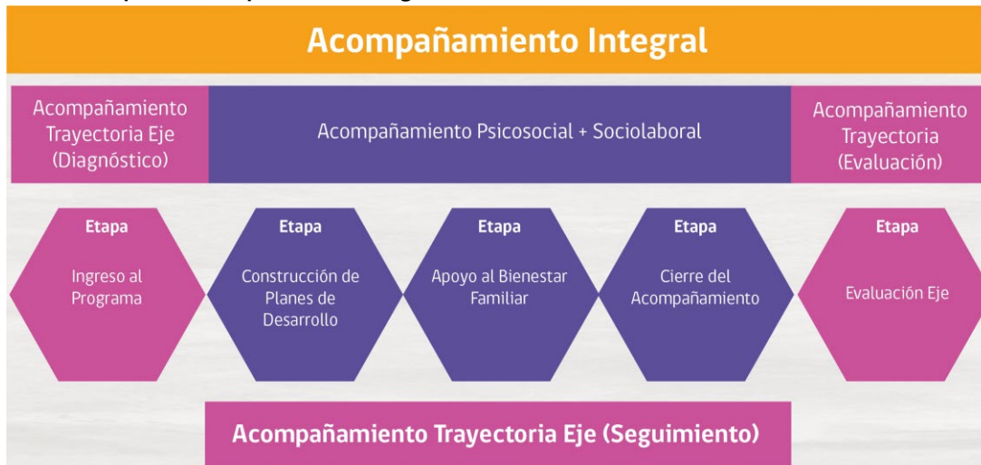
Gráfico 1. Etapas del Acompañamiento Integral

Los contenidos de este Plan se reflejan en las dos siguientes modalidades de intervención :