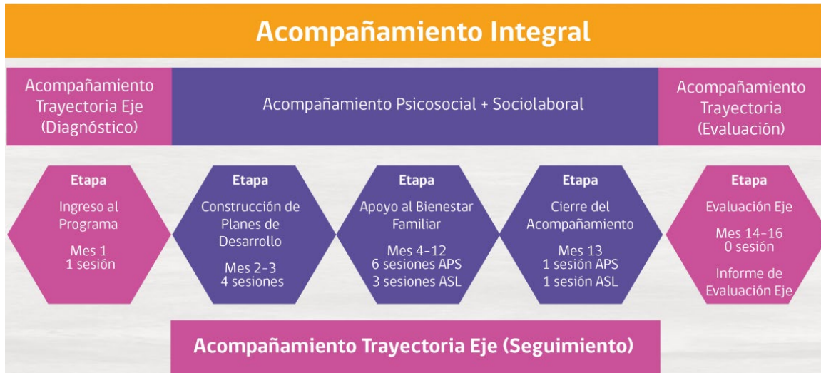
Gráfico 2. Periodicidad del Acompañamiento Integral reducido

Con relación a lo anterior y teniendo en cuenta las etapas y sesiones se consideran los siguientes parámetros: